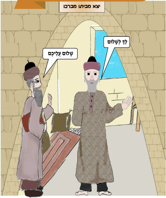
כל הכוונות שמורות למערכת "נחלת אבותינו" על מנת לשכפל ולצלם ללא רשות בכתב ממערכת העלון