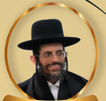
ראש הכולל הר"ג משה רצאבי שליט"א