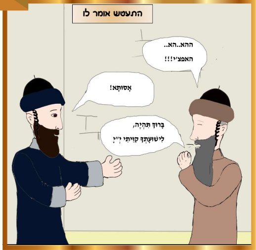
כל הזכויות שמורות למערכת "נחלת אבותינו" אין לשכפל ולצלם ללא רשות בכתב ממערכת העלון