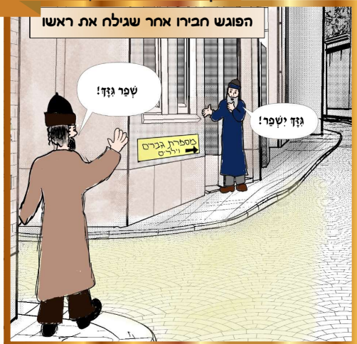
כל הוכיות שמורות למערכת "נחלת אבותינו" אין לשכפל ולצלם ללא רשות בכתב מסערכת העלון