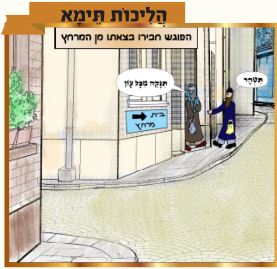
כל הכוונות שמורות למערכת "נחלת אבותינו" אין לשכפל ולצלם ללא רשות בכתב מסערת העלון