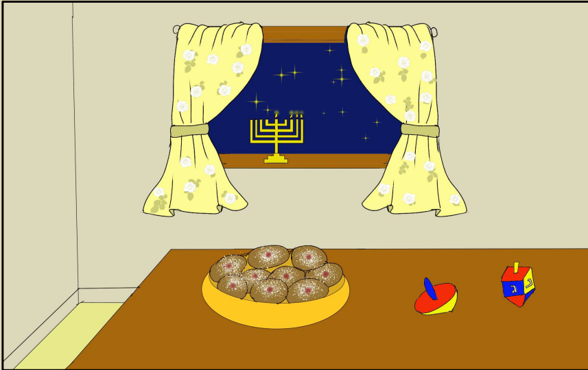
כל הזכויות שמורות למערכת "נחלת אבותינו" אין לשכפל ולצלם ללא רשות בכתב ממערכת העלון

רַבּוֹת, אֵל, מַלְאָכָה מַלְאָכָה לְלוּוִי, מַלְאָכָה