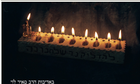
מנורת אבן שהדליקו בה בתימן