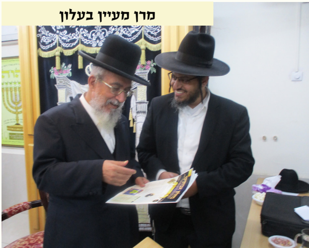
מרן מעיין בעלון