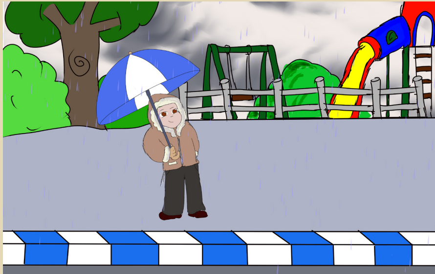
כל הזכויות שמורות למערכת "נחלת אבותינו" אין לשכפל ולצלם ללא רשות בכתב ממערכת העלון

זכות הלימוד בכלול "פרי צדיק" לכל השותפים בתרומות ובכללים: לע"ג הצדיק הרה"צ יורם מיכאל אברג'ל זצ"ל