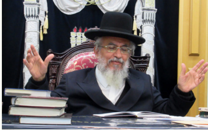
תמונות מהשיעור השבועי של מרן הגאון הרב יצחק רצאבי שליט"א