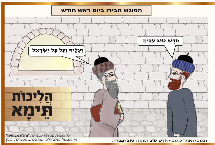
כל הופעות שמורות למערכת "נחלת אבותינו" אין לשכפל ולצלם ללא רשות ככתב מסמכת העלון