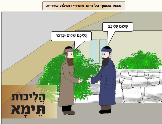
אם פגשו במקום שיש חשש טיפון, אומר רק עליכם. וכשפגשו את רבו אומר קרי, שלום עליכם

בשל ביקוש העלון בערים נוספות, זקוקים לתורמים עבור מימון העלון צור קשר: 053-345-3020 NA0546812981@gmail.com