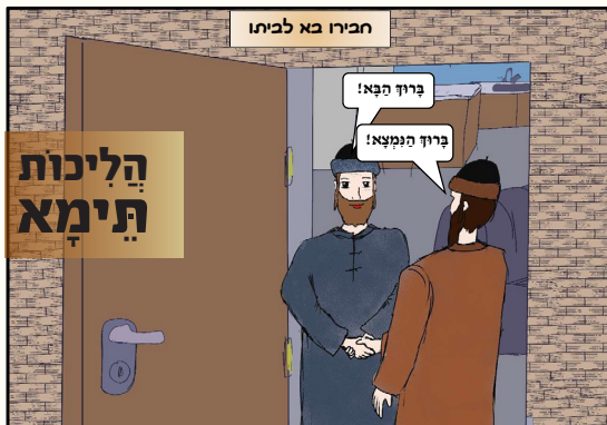
חבירו בא לביתו

לז) כל הזהיר במצות תפילין לנהוג בהם קדושה, שלא לדבר בהם דברי הבלים ושיחתחולין, מאריך ימים, ומובטח לו שהוא בן העולם הבא. שנאמר ו"י עליהם (שנושאים עליהם שם ה' בתפילין) יִחְיוּ, וְלֹכֵל בְּהֵן חַיִּי רוּחִי, ותחלימיני והחַיִּיני.