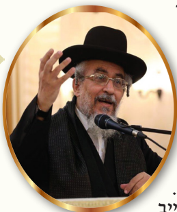
מתוך שו"ע המקוצר של מרן הגאון רבינו יצחק רצאבי שליט"א פוסק עדת תימן

סימן י' - הלכות דברים האסורים משהאיר היום עד לאחר שיתפלל