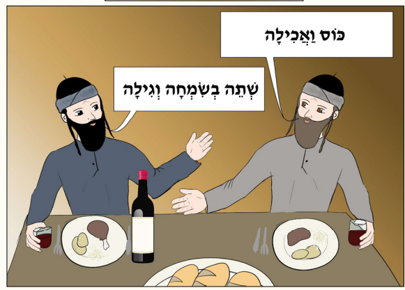
כל החכות שמורות למערכת "נחלת אבותינו" אין לשפלי ולצלם ללא רשות בכתב ממערכת העלון

העלון טעון גזירה | אין לעיין בשעת התפילה