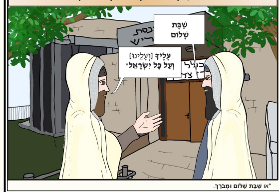
אי שבת שלום ומברך.

הפוגש חבירו בשבת, הן בבילה והן ביום וכן המסובין יחד בביל שבת