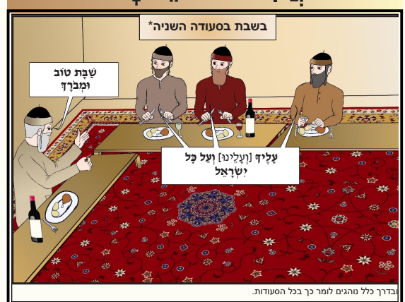
בדרך כלל נוהגים לומר כך בכל הסעודות.