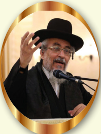
מתוך שולחן ערוך המקוצר של מרן הגאון רבי יצחק רצאבי שליט"א

הבית עומד עם האדריכל בחוץ ודן איתו על הצבע של החומה החיצונית, בא אדם אחד מהרחוב ואומר את דעתו "לפי דעתי זה צריך להיות בצבע סגול שיתאים לסביבה וכו'" בעל הבית והאדריכל מביטים אחד על השני ואח"כ עליו ואינם מאמינים למשמע אזנם, מיהרו לענות לו: "מה אתה מתערב בכלל? זה לא הבית שלך!" ענה להם אותו חכם "הרי אתם צובעים את החומה החיצונית בשביל מי?! בשביל העוברים והשבים, כדי שכולם יראו ויהנו! אז בהחלט יש לי את הזכות להחליט!" עד כאן המעשה. כל אחד יבדוק, האם אנחנו לא כך לפעמים, מנסים לרצות את השני ומשקיעים מאמץ וכסף וכו'?! את עם ישראל זה לא עניין! ואפילו בלעם מתוך עינו השתומה, ראה את הברכה הגדולה של עם ישראל שאין פתחיהן מכוונין זה מול זה, "מה טבו אהליך..." כשנראה מה יש לחבר שלנו, כמה הדשא שלו ירוק יותר, בואו נשנה את החשיבה, נברך אותו "כן יתן לו ה' וכן יוסיף" זה לא נדרש ולא מעניין, מה שיש לי הכי טוב בשבילי! "שמח בני בחלקך..." שבת שלום!