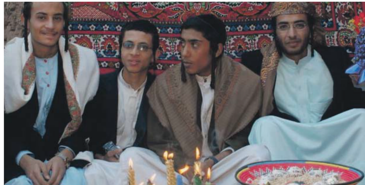
ערפל סמיך ומדאיג. צנעא, בירת תימן. משמאל: ארבעה מבני הקהילה, תמונה שצולמה לפני מספר חודשים