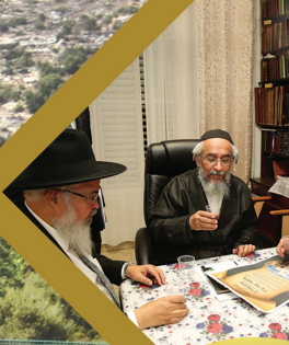
בעת אמירת "לחיים" וברכת מרן שליט"א לפרוייקט