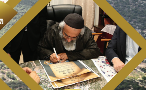
חתימה על "מגילת היסוד" לקרית מהרי"ץ