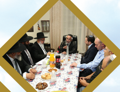
סקירה כללית על הפרוייקט ממנהלי חברת "הרי זהב"

רח' בירנבוים 13 בני ברק 51647, טלפון 03-6741445, 13 BIRNBAUM ST. BNEI BRAK 51647 TEL. קבלת קהל ושאלות בטלפון בין השעות 2:00-2:30 בצהרים (כולל יום ששי) ו-10:00-10:30 בערב - בל"ג