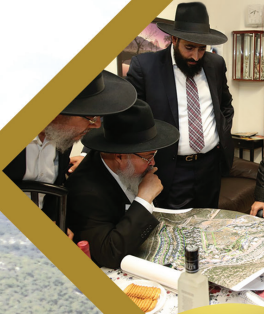
עיון במפות מיקום הפרוייקט