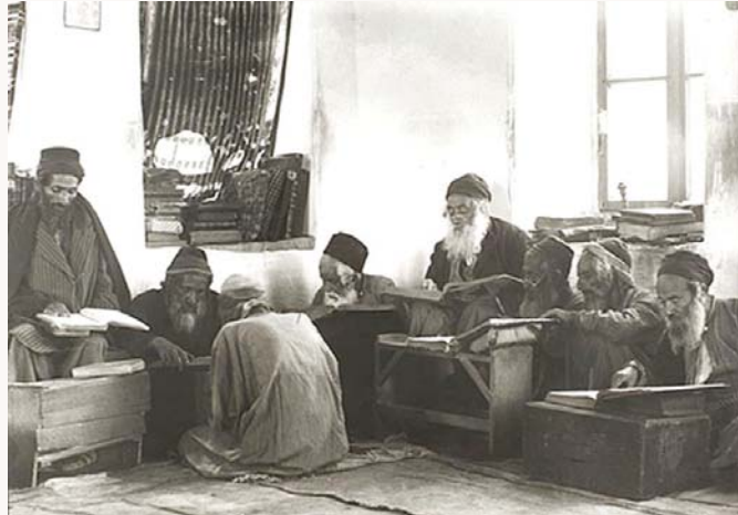
חכמי תימן בלימודם תצלום משנת תרפ"ח

מה היה הקשר התורני של חכמי תימן עם שאר חכמי ישראל שדרו בארצות אחרות? "בכל הדורות קמו בתימן חכמים גדולים ומרכזי תורה, מחברי ספרים וכן בתי דינים, שעמדו בקשר רציף של שאלות ותשובות עם מרכזי התורה הקרובים להם, כגון: לבבל בזמן הגאונים; למצרים בזמן הרמב"ם ובניו; וכן היה קשר עם חכמי ירושלים. וכבר כתב רב האי גאון בתשובה: 'אתם יודעים כי בארבע פינות נכנס בלבכם להחזיר התורה לישנה, שבה לה, ושולחים