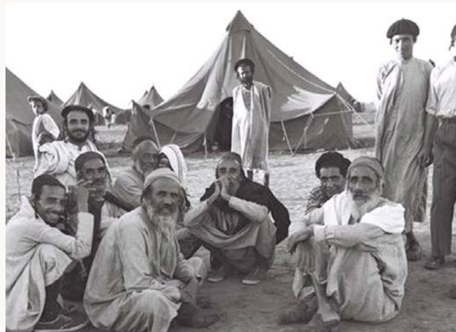
עולי תימן בארץ ישראל ימים ספורים לפני שראשי המדינה העבירו אותם על דתם

את מסורה זו ולהיות סמל של צניעות וקדושה".