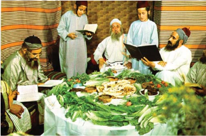
משפחה תימנית בעריכת סדר ליל פסח

משפחות תימן חוזרים לשרשים ולא זוכרים את מסורת אבות, הרי צעירים ל"שוע מסודר". גם בעבר היו שטענו, למה לנו רב ומורה, הלא אנשי המסורת אנחנו, מנהג אבותינו בידינו, לא נוז ולא נוזע הימנו? אכן, לא ידעו ולא יבינו כי בלא ידיעת ההלכה על ברייה, תהא המסורת חסרה. ובעצם זוהי בעצם שיטתו של גאון רבני תימן ותפארתם מהרי"ץ זצוק"ל [מורינו רבי יחיא צאלח], כי המנהג יסודות בהררי קודש, אך גם היא מסורה רק בידי גדולי ההוראה כי כבדת משקל היא. כך היא ק"ק תימן, עדת קודש מי מנה, איננה עדה אלא בתורותיה. את כל כוחה שואבת ויונקת מתורת האבות, אשר דבריהם יסודותם בהררי עז ומושחתים על אדני התלמוד והגאונים. ואף השבר אשר השברנו בעלייתנו ארצה, לא יתאחה בשום דרך, כי אם בדרך התורה, רק בזאת תרום קרנם בכבוד. צאי לך עדת קודש בעקבי הצאן, בהעמקת עיון בתור-תם הרחבה של רבותינו, ובשימת לב להנהגותיהם הקדושות של אבותינו. ורעי את גדיותיך, צעירי הצאן, יניקי וחכמי, על משכנות הרועים, רועי ישראל. ובה ותעוררי עורי.