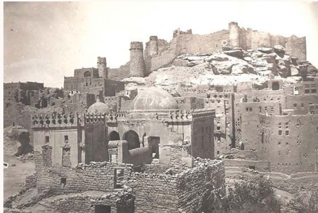
ארץ תימן תצלום משנת תרס"א