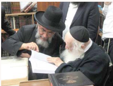
הגר"י רצאבי שליט"א מציג לגר"ח קנייבסקי שליט"א את תשובת הרמב"ם שנתגלתה לאחרונה

"נוסח השאלה לא הובא, לכן לא ידוע לנו מי הם השואלים ומאיו ארץ. רק מזה שהרמב"ם עונה לשאלה בלשון רבים, משמע שהשאלה הגיעה מכמה תלמידי חכמים אשר נועדו יחדיו לשאול את פיו על מה שנסתפקו בפתגמא דנא, אם אכן גבינהם של גויים וחמאתם אסורות, ומה טעם הדבר. ואם נכונה הטענה ששמעו כי החמאה מותרת, ממה שמצינו כי רבי ובית