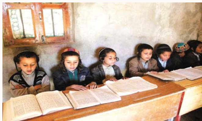
ילדים לומדים תורה בחדר בריינדא עיירה במחוז עומראן כ-70 ק"מ מצפון לעיר הבירה צנעה בתימן

בגבר שהכל היה בנוי בתימן על מסורת מוקפדת כולם ידעו את ההלכות על ברייה. אב"י במוני שהרבה מבני