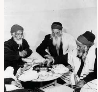
חכמי בני תימן בסדר ליל פסח

"שליחותיהו דרבנן קמאי עבדינו, צאי לך בעקבי הצאן ורעי את גדיותיך על משכנות הרועים, אמונים ונאמנים אנחנו למסורת אבותינו ורבותינו חכמי תימן נשמח מנוחתם בגן עדן, אשר היו מימי קדם המיסדת על אדני פז, ועל צבא תהילתם גאון עוזנו ותפארתנו מהרי"ץ זיע"א אשר לאורו אנו הולכים, ובצילו אנו מסתופפים. עינינו הוראות במונינו עקב קיבוץ הגליות כאן בארצנו הקדושה אין רבים נטמעו במנהגי שאר קהילות ישראל, דברים אשר לא שערום אבותיהם ואבות