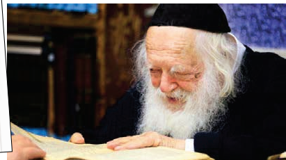
מרן הגר"ח קנייבסקי