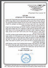
מכתבו של הגר"י רצאבי

בשבועות האחרונים הובא הנושא ע"י משפחות חטופי ילדי תימן להכרעה הלכתית בפני הגאון הגדול רבי יצחק רצאבי שליט"א פוסק עדת תימן | עמ' 6