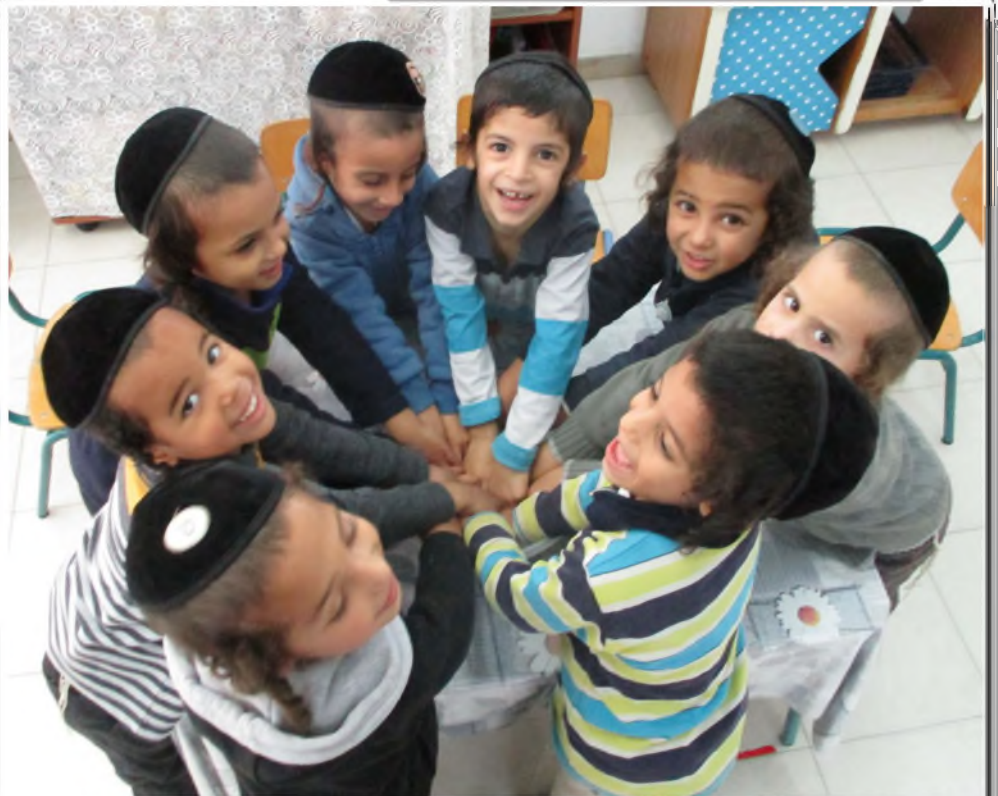
בחסד ה', שמחה בוקעת שחקים ומצאת תמיד ב'עטרת חיים'