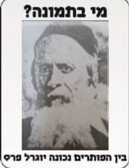
בין הפותרים נכונה יוגרל פרס

חשמונאי. ל' מן יאתנו חשמנים וכו' לא שהוא שם חניכה (ב"י ב' א"ח). ואולי מפני זה כי הפר"ח לגרוס האל"ף בחירק והוא נכון ע"פ הדקדוק דברבים אתה אומר חשמונים ובנפרד חשמונאי כי ה"יוד הישראלי ראובני וכו' אלא שהנוסח השגור בפי הכל וגם בתכאל"ל ניקדוהו הנו"ן בפת"ח, ולפע"ד אולי שהם סוברים דמלת חשמונאי לא ל' גדולה היא אלא שם בפני עצמו והיא חניכתו וכינויו, ושוב מצאתי להרד"א שכתב יוחנן המכונה חשמונאי ע"כ, או שהיו לו שני שמות יוחנן וחשמונאי דא"א דלא היה שם הכהן הגדול הזה מפורסם בניקודו ובודאי מסורת הקריאה בידנו כמו שהיה באמת: