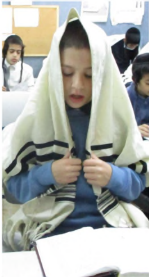
על זכותם העולם עומד...