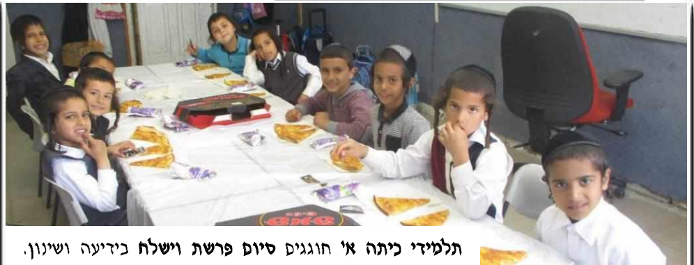
תלמידי כיתה א' חוגגים סיום פרשת וישלח בידיעה ושינון. יה"ר שיזכו לכרך על גמרה של תורה אכ"ר