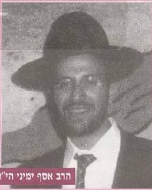
הרב אסף ימיני הי"ו