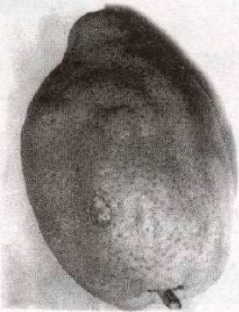
מאמר עץ פרי • תשובות • הלכות כשרות האתרוג