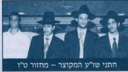
חתני שו"ע המקוצר - מחזור ט"ו